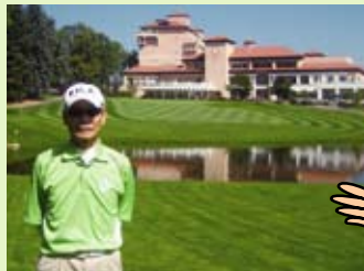
コロラドスプリングスリゾート