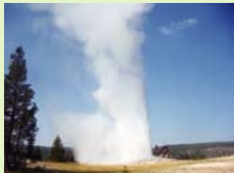
イエローストーン